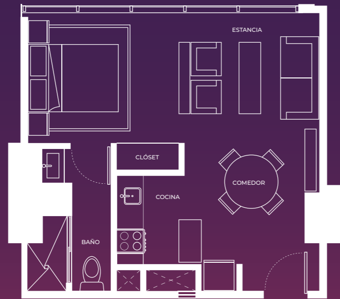
Depto. Tipo 09