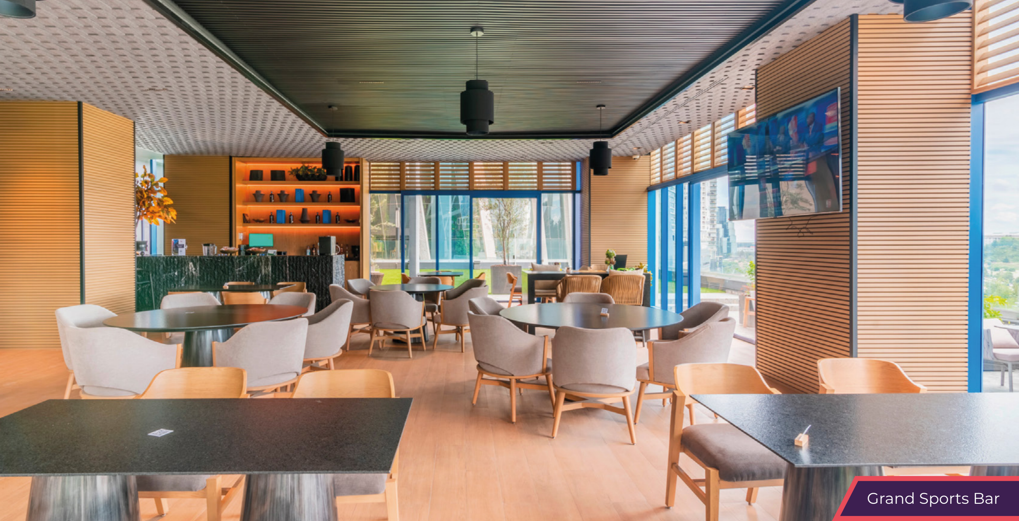
Grand Sports Bar