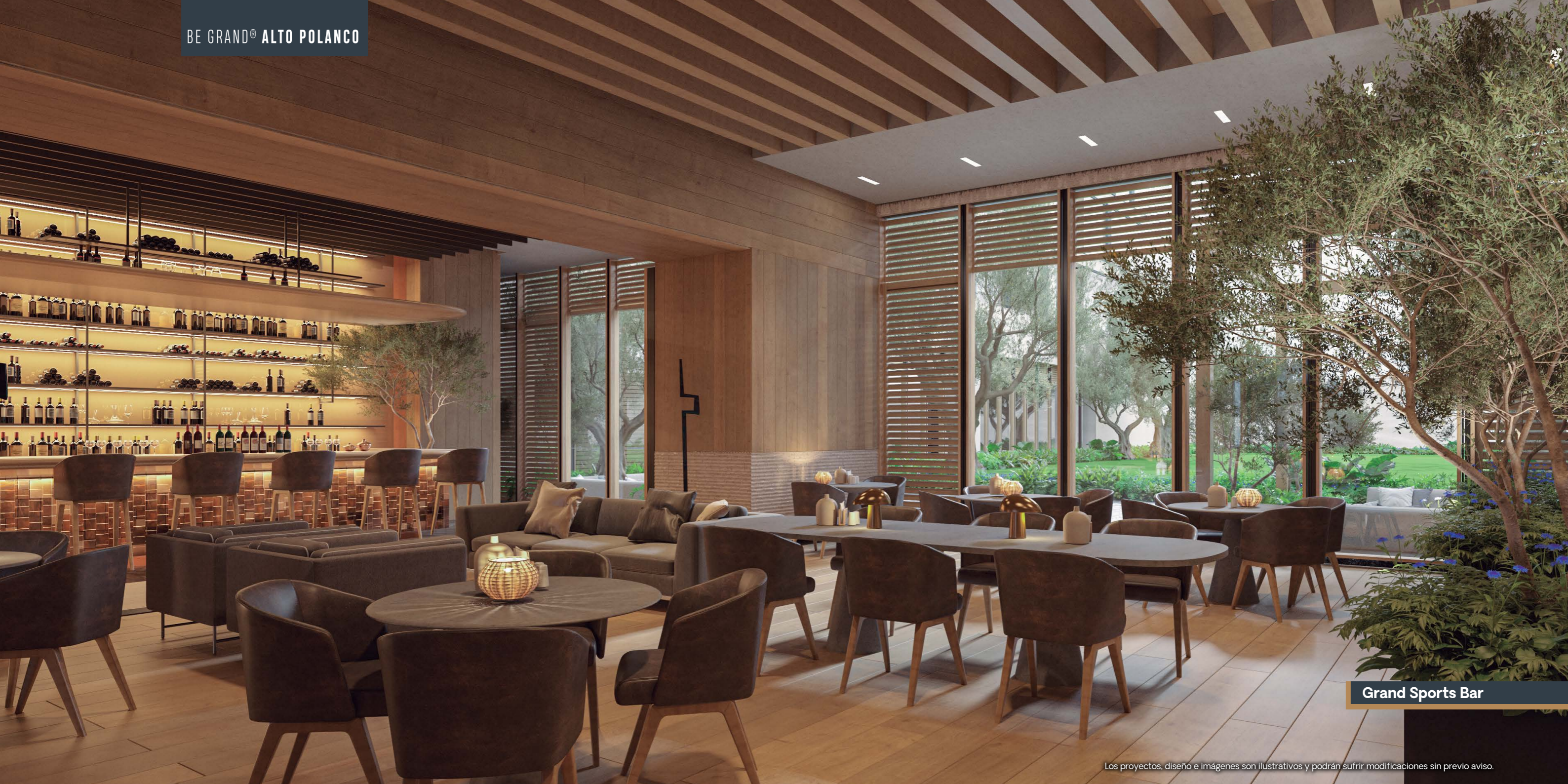
Grand Sports Bar