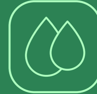
WC, REGADERAS Y LAVABOS DE BAJO CONSUMO