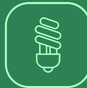
ILUMINACIÓN LED DE BAJO CONSUMO