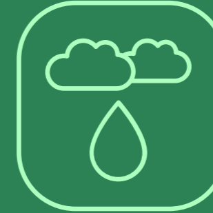
APROVECHAMIENTO DE AGUA PLUVIAL