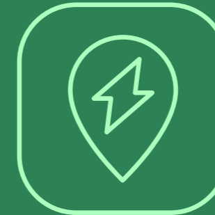
SENSORES DE MOVIMIENTO