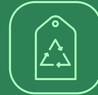
ESPACIO DE ACOPIO Y SEPARACIÓN DE RESIDUOS