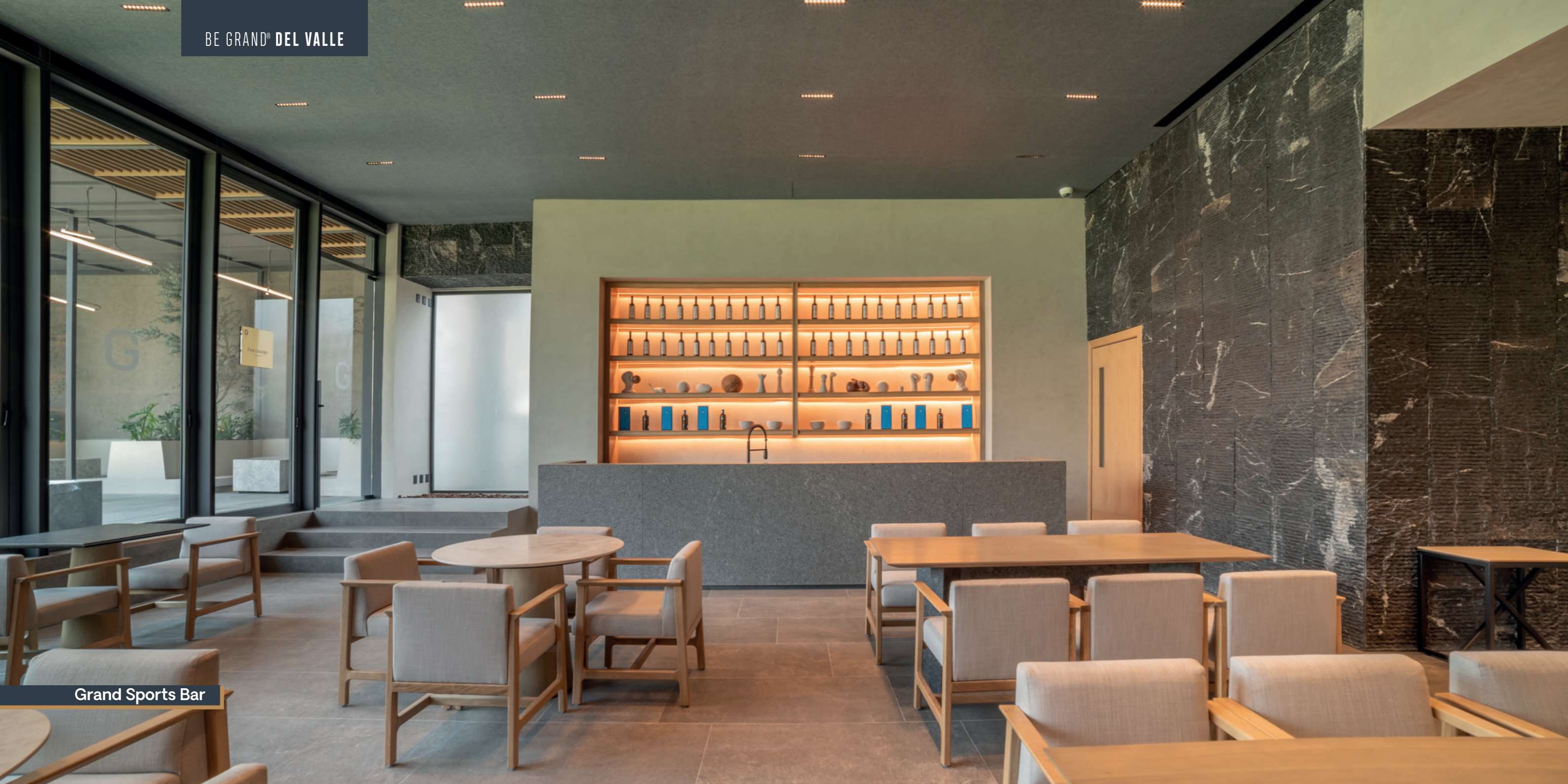
Grand Sports Bar